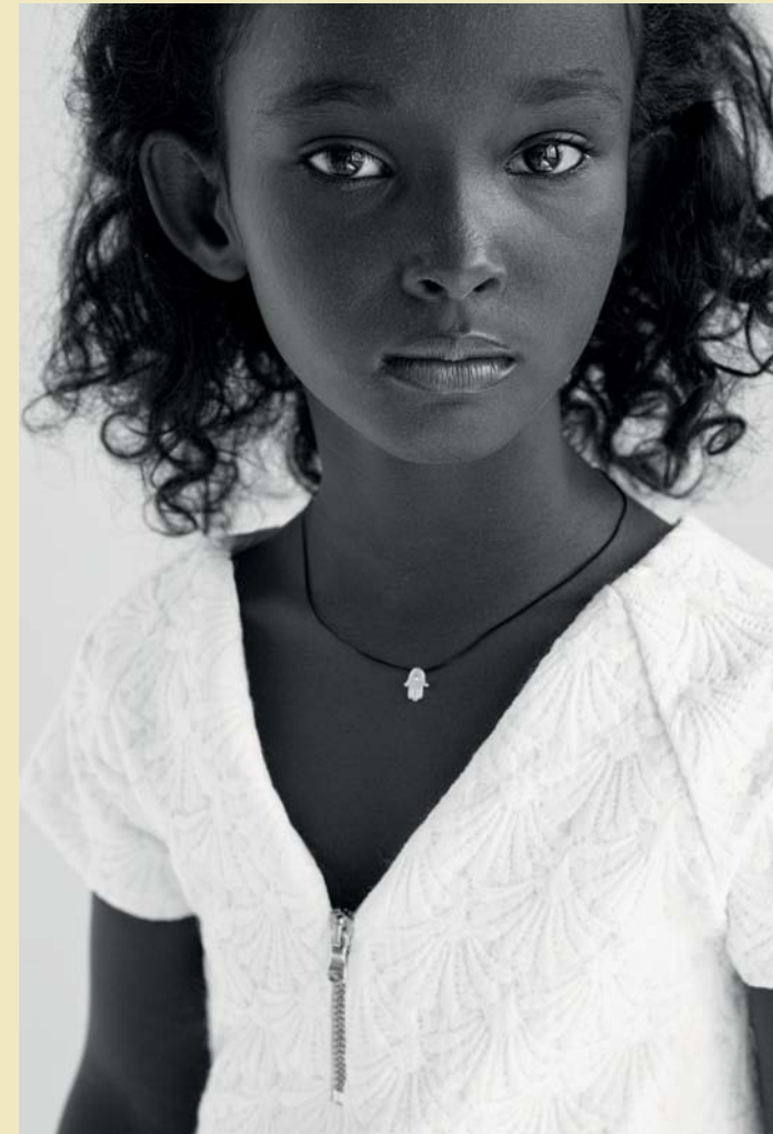
Safa 2013 - ein selbstbewusstes afrikanisches Mädchen

Mit dem Kauf von HAND for LUCK unterstützen Sie die DFF bei der Rettung einer kleinen Wüstenblume.